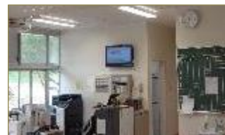
↑ 職員室のモニターで指数を表示(中央)

猛暑、酷暑の時期となっています。学校では、運動による熱中症の予防のため、環境省HPのリアルタイム「暑さ指数」を確認しながら、状況によっては運動中止とすることも想定して取り組んでいます。但し、暑さ指数の指標は健康な場合です。朝食抜きの栄養不足や水分不足、睡眠時間などの休養不足の場合は熱中症になりやすいといわれています。学校に送り出す際には健康状態の御確認をお願いします。