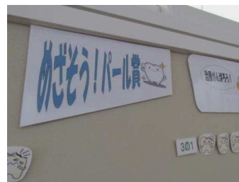
【保健室前の掲示板。クラス全員が治療を終えるとパール賞】