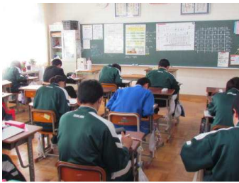
【昼休みの学習会風景】

昨日、全学年で学力テストが行われました。年度末のまとめのテストで、今回はマークシート方式によるものでした。 下の写真は3年生の昼休みの学習会の様子です。同時に、別室ではⅡ期選抜受験に向けた願書作成指導が緊張した雰囲気の中で行われ、受験のまっただ中でのテストでもあり大変でした。また、1・2年生にとっては、来週期末テストを控えており、来年・再来年を見据えてぜひ学力向上に励み、進路実現に向けて頑張してほしいと思います。