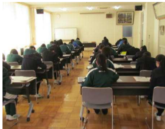
【Ⅱ期願書作成指導風景】