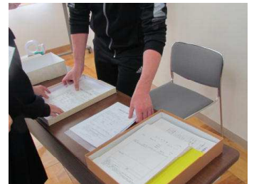
【下書きした願書を提出】