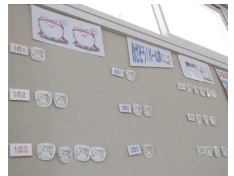
【保健室前の掲示板。クラス全員が治療を終えるとパール賞】

【学校医の西牧先生から】 今年度、保健講話として1年生では「食育」、2年生では「性に関する思春期講話」、3年生では、「薬物乱用防止教室」が実施されてきました。これらをテーマとした講話が必要とされるということは、現代社会の問題点を表出しており、このような環境下で生きる子どもたちは大変ではありますが、たくましさを身につけて頑張してほしいと思います。 ※3年生の薬物乱用防止教室は2/19(金)に実施予定です。