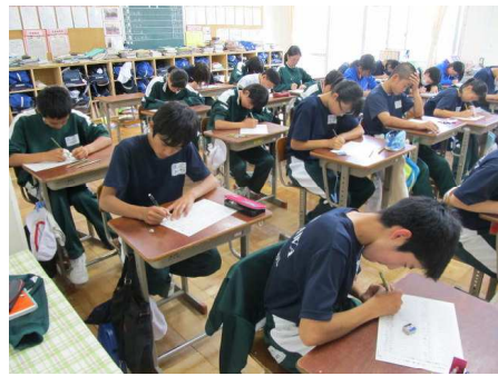
【昼休みを利用しての学習】 【ノートを使って何度も練習】 【本番で真剣に取り組む3年生】