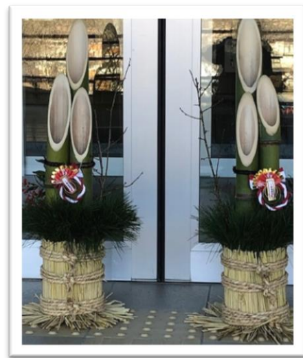
<SSSさん手作りの掲示と用務員さん手作りの門松が、新年と共に子ども達を迎えます。>