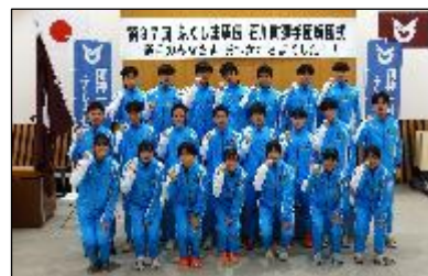
↑力走を終えたメンバー (町の解団式にて)