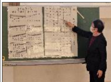
↑ 見慣れた五線譜(左)と箏の楽譜(右)を比べながら説明する〇〇先生

1学年の音楽科「日本の音楽に親しもう」という単元で、箏（こと）の授業を行っています（→）。講師として〇〇〇〇先生をお迎えするとともに、箏を他校から借りるなどして十分な数を揃えました。3週間にわたって学習する計画